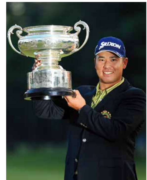
プロとして初挑戦でつかんだ優勝カップに笑顔を見せる松山英樹