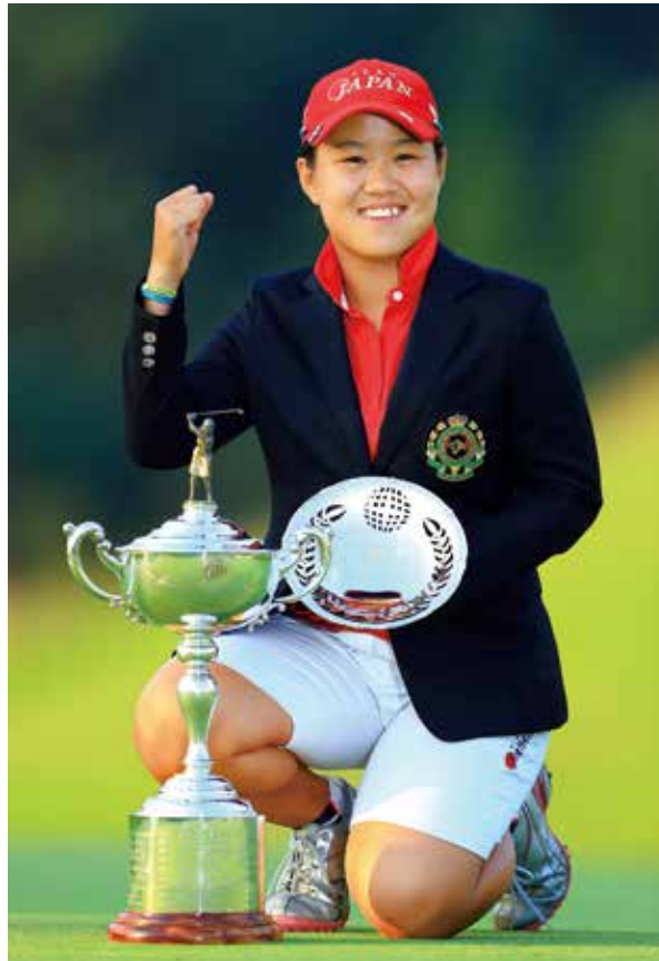
優勝杯とローアマ銀皿を手に笑顔が弾ける畑岡奈紗