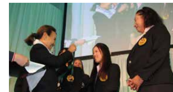
メダルを授与される日本女子チーム