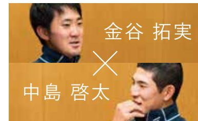
2019年度 JGAナショナルチーム選手一覧 18-19