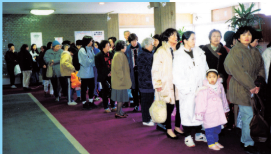
1995年阪神・淡路大震災時に宝塚ゴルフ倶楽部が近隣住民に浴室を提供した