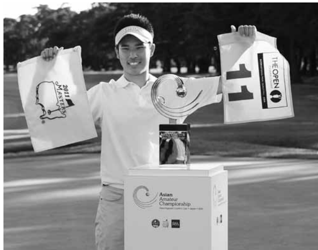
2年連続でマスターズに出場した松山英樹選手。